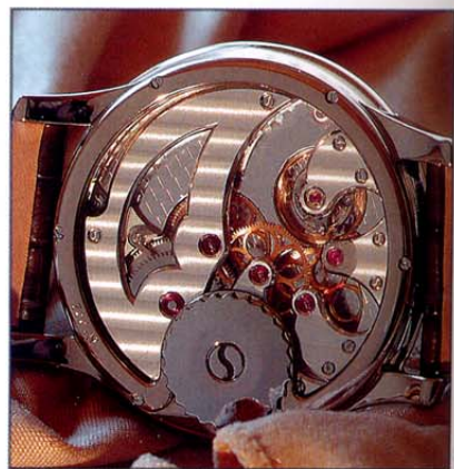
Détail du mouvement 2206 Hm.

de seconde et le balancier ainsi qu'un remontage manuel plat sous le garde-temps permettant d'effectuer l'opération sans avoir à enlever la montre du poignet. Vu de l'extérieur, le boîtier est parfaitement rond et très élégant, sans couronne apparente. Le cadran guilloché à la main s'orne d'un plus petit indiquant les heures et les minutes. Quatre modèles hommes sont disponibles en versions or rose, or blanc et platine. Chaque édition sur commande est limitée à trente-huit pièces et à huit pour les modèles sertis diamants baguettes. L'objectif 2008? «Soixante montres. Mais je ne fabriquerai que 365 mouvements 2206 Hm pour le monde entier, c'est tout.»